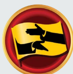
Επιρροή με Πειθώ